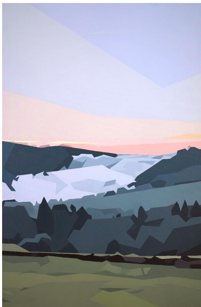
My Everything (huile sur toile, 80 x 120 cm), tableau réalisé par Cédric SELMI sur base de photo